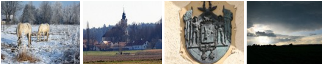
Sandizell mit Asamkirche und Wappen am Schloss

Auf einem gut ausgebauten Feldweg geht es wieder zurück an die Ach. An der Brücke befindet sich ein kleines, altes Donaumoos-Anwesen, der „Hof an der Ach“. Weiter geht die Fahrt nach rechts in Richtung Sandizell . Abstecher zur berühmten Asamkirche und dem Wasserschloss lohnen sich.