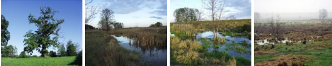
Am Seeanger bei Pöttmes

Die Weidefläche der "Auerochsen" kann als Besichtigungspunkt in den Donaumoos-Radweg eingebunden werden. Vom Radweg Pöttmes – Klingsmoos am Hinweisschild „Achbrücke“ rechts abbiegen. Direkt nach der Achbrücke kommt das Wasserrückhaltebecken „Seeanger“ mit Moorschnuckenbeweidung .